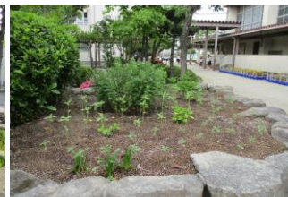
サンパチェンスと大輪ヒマワリを植えました