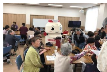
(ヤクルト君と一緒に健康体操)