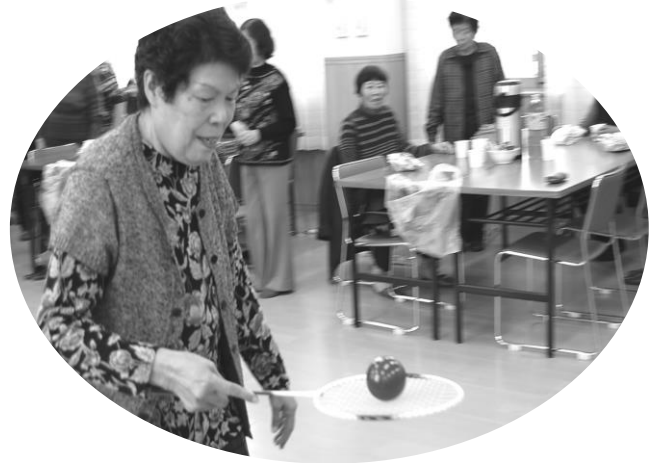
若いもんには負けへんで一特に口はなァ