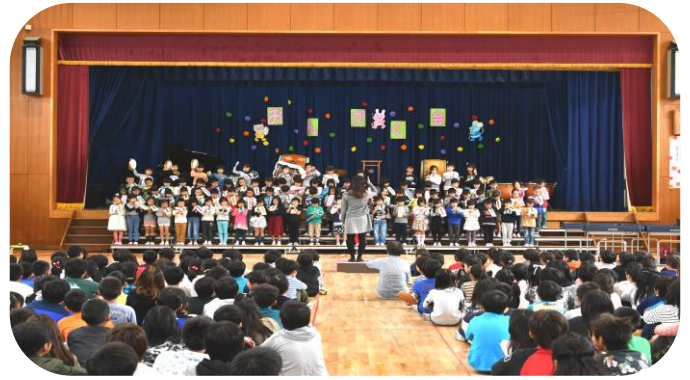
【1年生】よろしくお願いします。