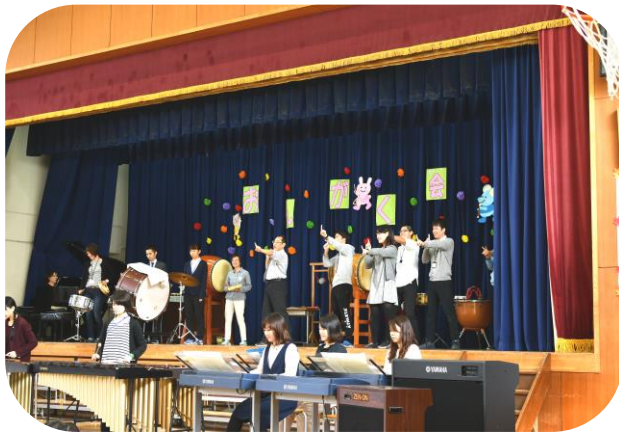
【先生方】ちょっと照れてました？