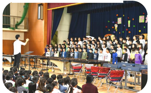
【6年生】有終の美を飾って