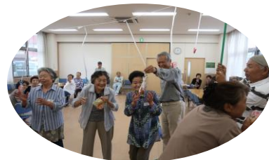
6月 - ミニ運動会