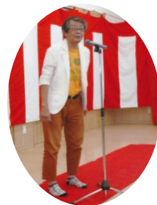
9月 - いきいき寄席