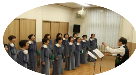
12月 - フリージアコーラス レスポアの皆さん