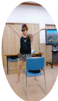
8月 - かくし芸大会